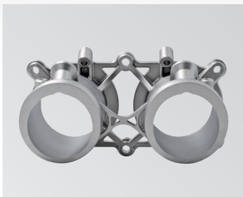
样品名称：赛车喷油器支座 打印设备：FS273M 打印材料：FS AlSi10Mg

该部件是发动机喷油器的支座，为了防止燃油泄漏产生意外，就要保证各个喷油器支座之间的间距相等，如采用传统铣削工艺来制作，一是加工难度大，需要五轴数控铣床才能加工出来；其次是铣削量较大，材料利用率不高；而采用3D打印技术既可提高材料利用率，又能实现轻量化设计后复杂结构的生产要求。