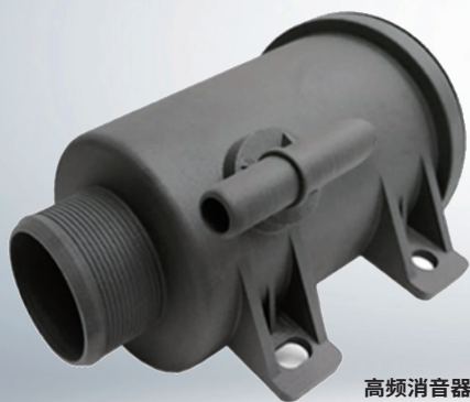
高频消音器 打印设备: Flight HT403P

免责声明: 影响产品性能的因素较多, 华曙建议您在使用前进行测试, 确定产品是否适合您的特定用途。华曙不做任何形式的保证, 包括但不限于适销性或适用于特定用途的承诺。华曙保留更改技术数据权利, 恕不另行通知。